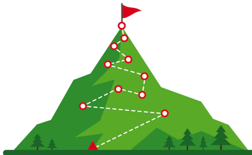
Figuur 5: Route naar de top; een weg van vallen en opstaan

buitenland. Het aantal internationale toernooien kan mogelijk iets variëren en het zijn bekende representatieve toernooien volgens Europese standaard en in het buitenland.