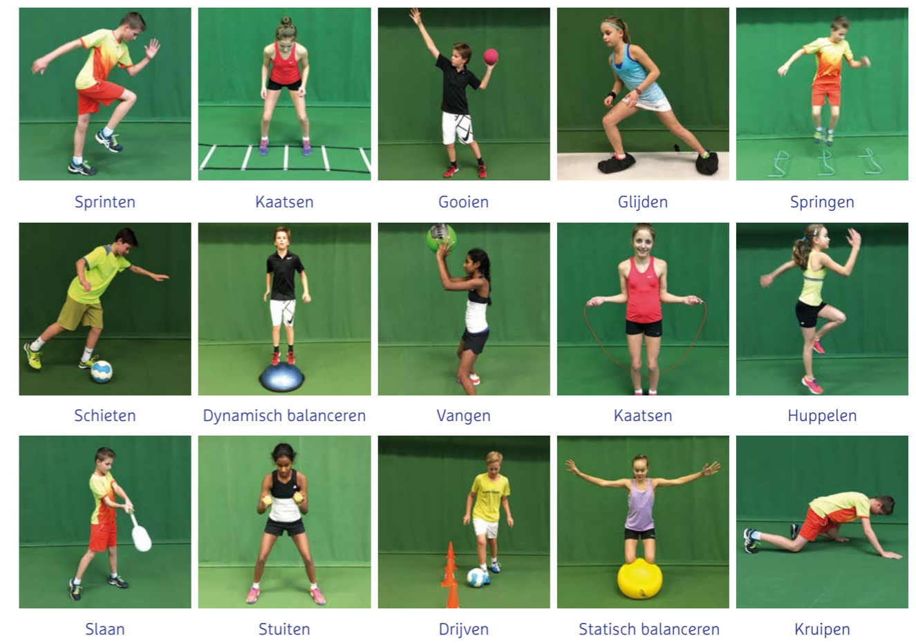
Figuur 1: Fundamentele bewegingsvaardigheden.

Fundamentele bewegingsvaardigheden zijn onder andere: statisch en dynamisch balanceren, stuiten, sprinten, springen, glijden, kruipen, gooien, kaatsen, huppelen, drijven, schieten, slaan en vangen (zie figuur 1).